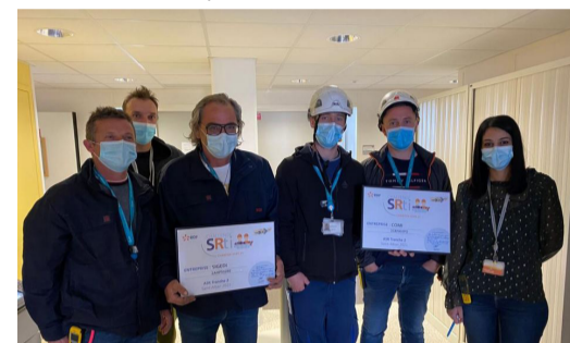
Mi-avril, l'entreprise Sigedi a été récompensée au titre challenge SRTI pour la prise en compte de la sécurité sur ses chantiers.

Au travers de ce challenge, l'engagement de plusieurs centaines d'entreprises en faveur de la sécurité a ainsi été valorisé, contribuant à l'amélioration continue des résultats du site dans ce domaine.