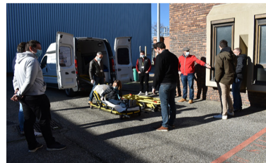
Chaque sauveteur-secouriste du travail participe à un recyclage tous les 2 ans pour maintenir ses compétences.

Les sauveteurs-secouristes jouent un rôle essentiel en matière de prévention et pour donner les premiers secours.